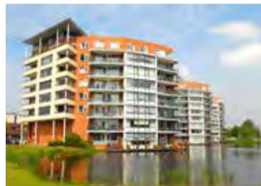
Achterkant Huub van de Brulestraat

Nautastraat, Gerhard, 1884-1967, jurist, hoogleraar aan de Nederlandse Handelsschool