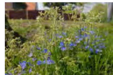
Mensen, ga eens op uw buik liggen. Wat je dan al niet voor moois kunt zien!