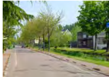
Gerardus van Sillevoldtstraat